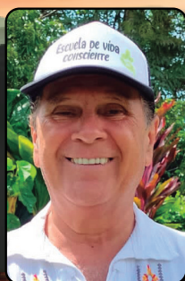
Por: Rodolfo García G. Promotor de la escuela de vida consciente

Me parece excelente que busquemos cumplir múltiples objetivos externos, que trabajemos para tener un mejor nivel de vida y que busquemos realizar nuevos proyectos. Esto es magnífico, pero nunca dejemos de incluir el crecimiento interior.