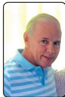
Por: Luis Javier Valencia