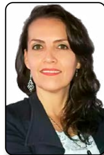
Por: Claudia Loaliza González

La resiliencia no nace de la perfección, sino de la capacidad de levantarse una y otra vez.