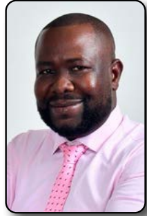
Por: Carlos Cuesta Pizarro Especialista en Gerencia Social y Negocios

Antes de hablar de crecimiento, expansión o rentabilidad, es necesario detenerse en algo más esencial: entender cómo está funcionando realmente la empresa. Muchas organizaciones creen tener control sobre sus