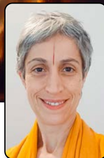
Por: Chaitali Chaitanya

E n el dinámico mundo de los negocios internacionales, solemos medir el éxito a través de indicadores de rentabilidad, cuota de mercado o volumen de ventas. Sin embargo, existe un concepto milenario que está empezando a ganar terreno en los consejos de administración más vanguardistas: el Dharma. Esta palabra, de origen sánscrito, se traduce a menudo como “propósito”, “ley universal” o “deber ético”. Aplicada al entorno empresarial, el Dharma transforma la visión de una compañía, pasando de ser una simple máquina de generar beneficios a convertirse en una entidad con alma y sentido. El Negocio como Servicio al Orden Universal