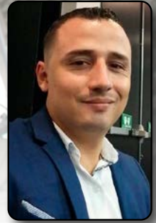
Recopilado por: Federmán Bedoya Vásquez

quien no se preocupa por hacer un uso adecuado de su agenda. Y aunque quien escribe este artículo no es perfecto, sí es alguien comprometido con la puntualidad, pues no hay nada tan bueno que no pueda ser mejorado. Debemos mantenernos en esa búsqueda de la mejora continua. Uno de los pilares que he hallado en mi crecimiento profesional ha sido Círculos Elicda: una escuela liderada por un profesional ejemplar que, junto con su esposa, nos inspira no solo con sus palabras, sino todos los días con su ejemplo. Muchas gracias.