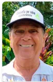
Por: Rodolfo García G. Promotor de la escuela de vida consciente

Podemos y debemos vivir con mayor consciencia. El objeti-