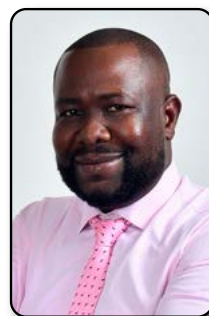
Por: Carlos Cuesta Pizarro Especialista en Gerencia Social y Negocios

Cuando todo pasa por el empresario las decisiones, operaciones, ventas y control entonces lo que existe es un negocio dependiente, no una organización sólida. Y esa es precisamente la realidad de muchos emprendimientos en el país. Aunque contar con un registro mercantil y estar inscrito en Cámara de Comercio es un paso importante, no es suficiente para hablar de empresa. La verdadera construcción