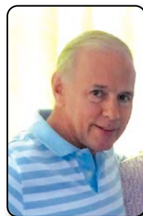
Por: Luis Javier Valencia Monsalve